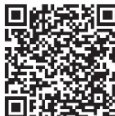
Download Civis (Android)