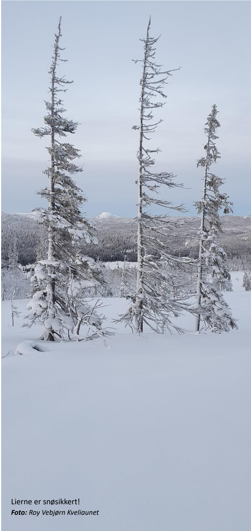
Lierne er snøsikkert!