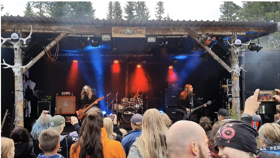
Fra Totsåsrock sitt arrangement for barn og unge.

Et godt og utviklende oppvekstmiljø er en innsatsfaktor i framtiden.