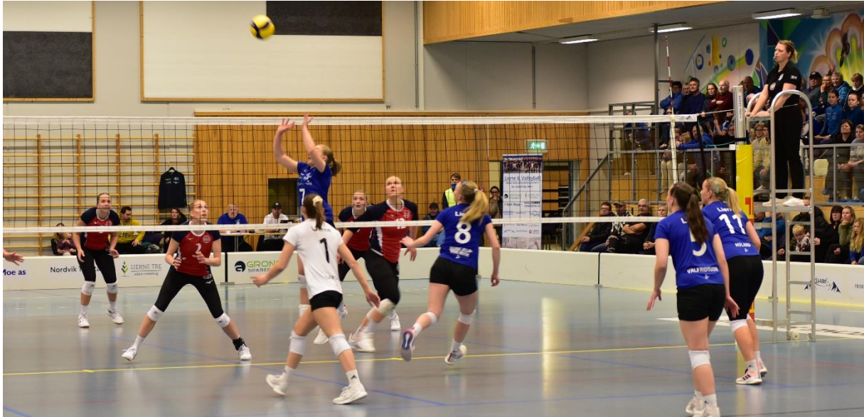
Lierne har et aktivt idretts- og trimmiljø. Her fra en volleyballkamp i eliteserien for kvinner.