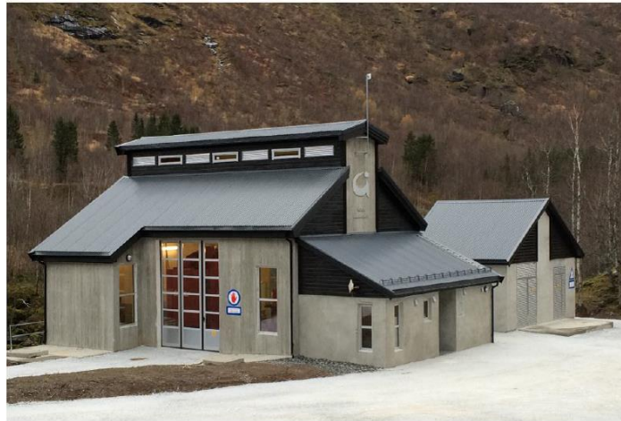
Leirelva og Tverråga kraftverker, Leirskardalen i Hennes

Norsk Grønnkraft bygger nytt kraftverk i Lierne kommune. I den anledning ønsker vi å presentere oss og planene for allmennheten i et åpent møte i Storsalen, Lierne Rådhus. Samtidig vil NTE Nett orientere om den tilhørende nettoppgraderingen.