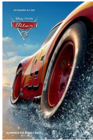
BILER KL 18.00