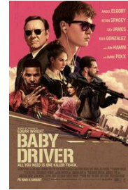
BABY DRIVER KL 20.00