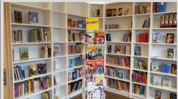
Det «nye» biblioteket.

Resultatet ble et flott og attraktivt bibliotek, - med den hyggelige effekten at utlån av bøker økte markant, - og et funksjonelt SOL-rom der alle skolens læringsressurser i lesing er samla på en plass. Alt av materiell er systematisert etter de ulike nivåene man bruker innen lesing, og er et godt hjelpemiddel i arbeidet med å fremme elevenes leseutvikling.