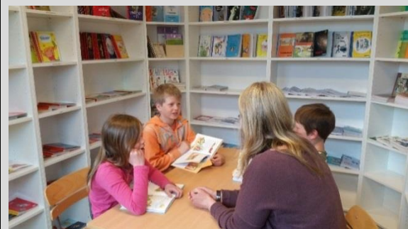
Inne på SOL-rommet.